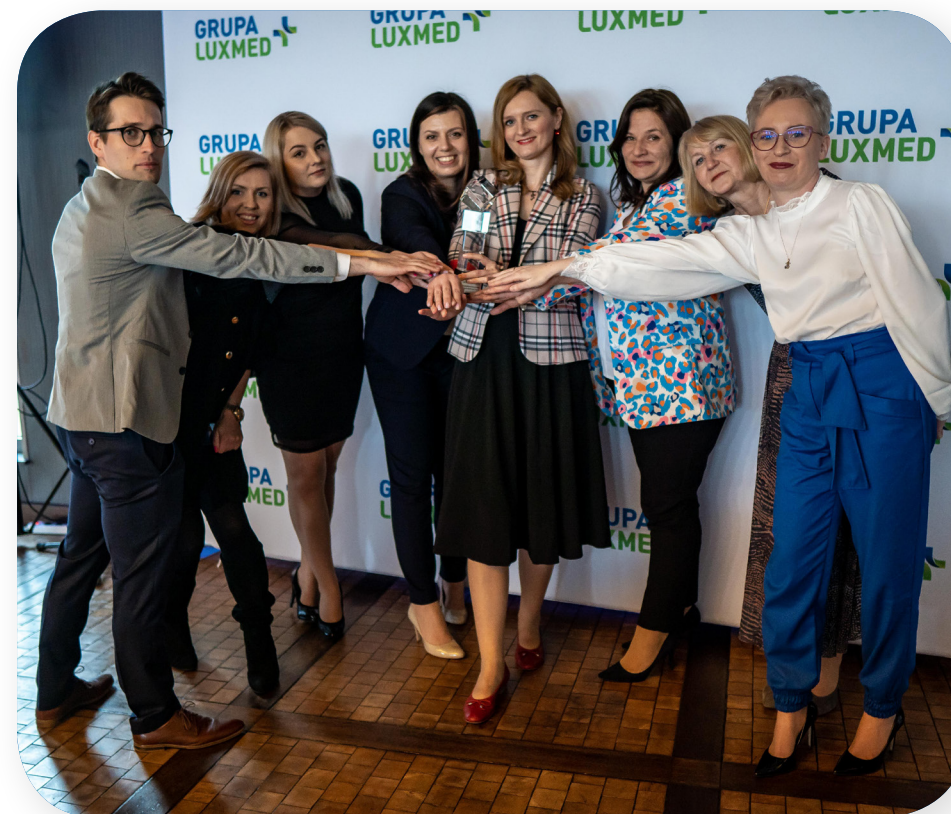
Perły Grupy LUX MED 2022 – Zespół Medycyny Pracy nagrodzony w kategorii "Wyjątkowość w opiece nad Pacjentem i Klientem".

Każdego roku świętujemy jubileusz pracy w Grupie LUX MED. Podczas wyjątkowej gali dziękujemy Pracownikom, którzy są z nami 10 lub 20 lat. W 2022 roku doceniliśmy zaufanie i zaangażowanie ponad 200 Pracowników.